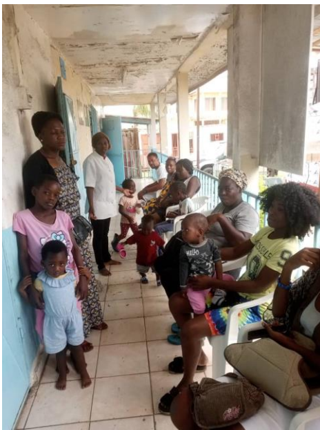
Photo ci-contre : Attente des mamans et des enfants devant l'antenne.

Le Lions Club de Port Gentil apporte toujours un soutien financier partiel mais vital pour les consultations du jeudi et la maintenance des bâtiments.